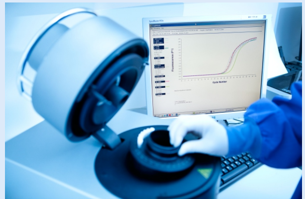
Abb.1: Real-Time PCR am LightCycler

Die Verwertung genetischer Komponenten durch HLA-Typisierung zur Früherkennung und Risikoeinschätzung des Diabetes mellitus Typ 1 galt bislang als sehr aufwändige und teure Untersuchung. Anstelle der früher erforderlichen, anspruchsvollen molekularbiologischen Verfahren können jetzt durch zwei vergleichsweise einfache, SNP-basierte Real-Time-PCR's die Hochrisiko-HLA-Genotypen mit hoher Sensitivität und Spezifität, aber vertretbarem Aufwand und deutlich niedrigeren Kosten indirekt nachgewiesen werden.